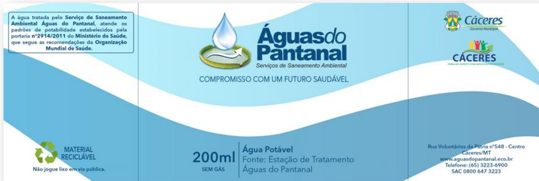
Área de Impressão do copo de Água Mineral 200ml