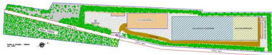
Figura 2 - Planta de Locação do Aterro Sanitário de Cáceres/MT

Atualmente a vala para depósitos de resíduos urbanos possui manta PEAD de e-2 mm com dimensões de 120x95x6 m, composta por sistema de drenagem de percolado e gás, sistema de drenos testemunhos e rede coletora de percolado. O projeto de expansão (a ser executado pela Autarquia) considera a vala finalizada nas dimensões de 400m x 100m com alteamento na mesma proporção.