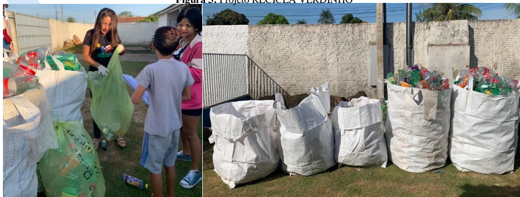
Figura 3: Projeto RECICLA VERDINHO