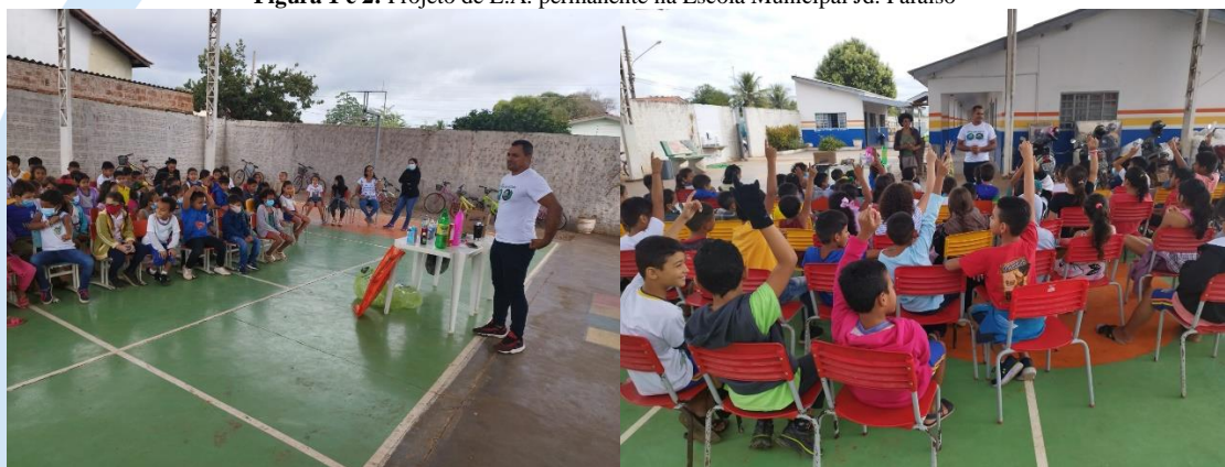
Figura 1 e 2: Projeto de E.A. permanente na Escola Municipal Jd. Paraíso

Em maio foram realizadas ações de educação ambiental em escolas, sendo algumas, projetos próprios da Autarquia, como o projeto de educação ambiental permanente, e outros projetos como o RECICLA VERDINHO, que é realizado com parceria do SEBRAE e PREFEITURA, cujos projetos tem como objetivo a conscientização ambiental do público infantil.