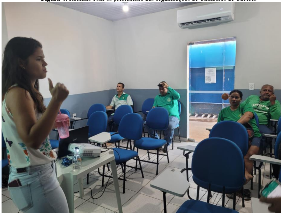
Figura 4: Reunião com os presidentes das organizações de Catadores de Cáceres