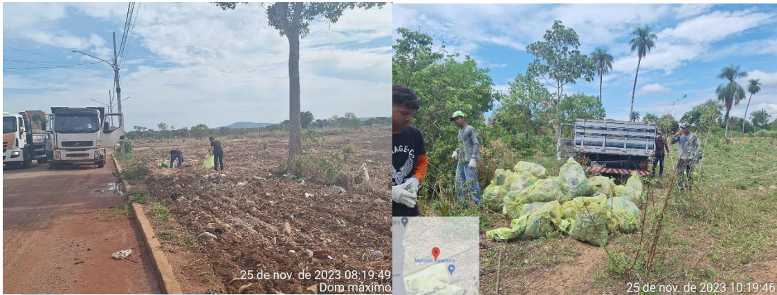
Figura 04: Primeira imagem - Dom máximo e segunda imagem Garcês

Conforme como consta no cronograma, no mês de novembro, foi realizada a limpeza nas áreas do residencial dom máximo e Tubulação Drenagem do bairro Garcês no dia 25 de novembro.