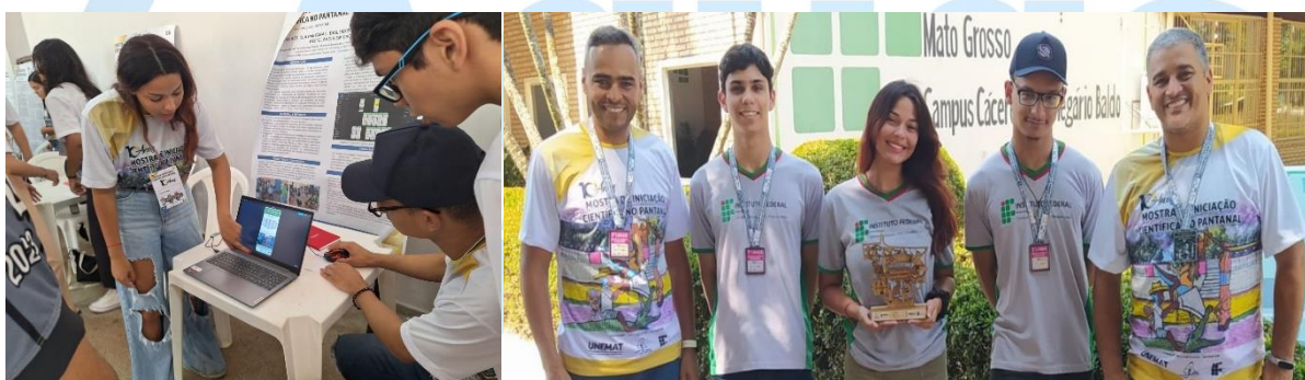
Figura 01: Alunos e professores do projeto na mostra científica do Pantanal

No último dia 10 e 11 de novembro, os estudantes do projeto do Aplicativo Recicla Pantanal foram agraciados com o primeiro lugar na categoria de Desenvolvimento Tecnológico durante a 10ª Mostra de Iniciação Científica no Pantanal. O prestigiado evento teve seu palco no salão de eventos da Secretaria Municipal de Turismo e Cultura (SMTC). O aplicativo Recicla Pantanal será disponibilizado à população, promovendo uma efetiva melhoria na conscientização sobre a separação de resíduos e fornecendo informações relevantes sobre a destinação correta, reforçando assim o compromisso ambiental e social dos moradores. Este projeto vitorioso representa um passo significativo para a preservação do Pantanal e a construção de um futuro mais sustentável.