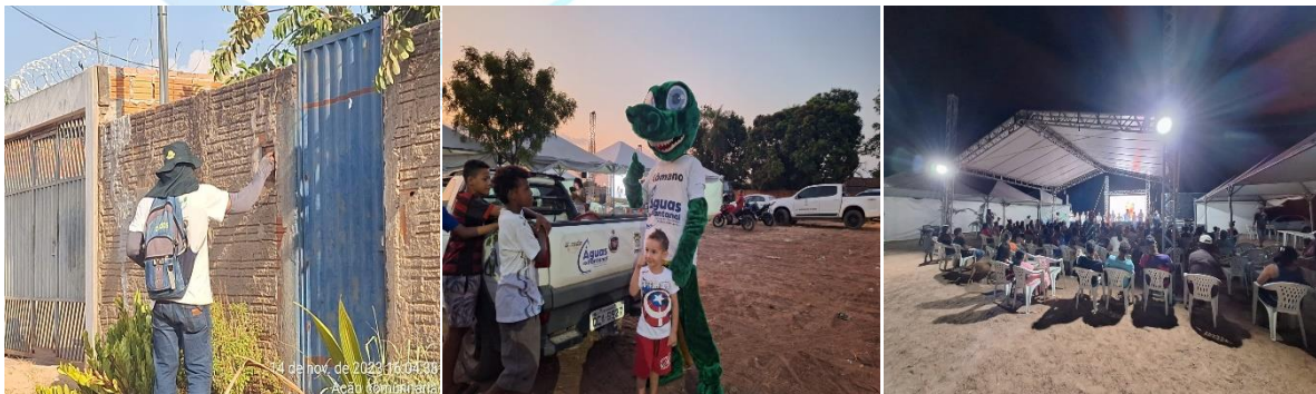
Figura 03: Ação Comunitária

A participação da autarquia envolveu a distribuição de folders nas residências desses bairros durante a tarde, com orientações sobre a coleta seletiva. À noite, o mascote Xômano marcou presença, contribuindo para o engajamento da comunidade no evento.