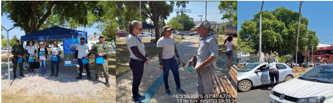
Figura 02: Blitz educativa em Cáceres